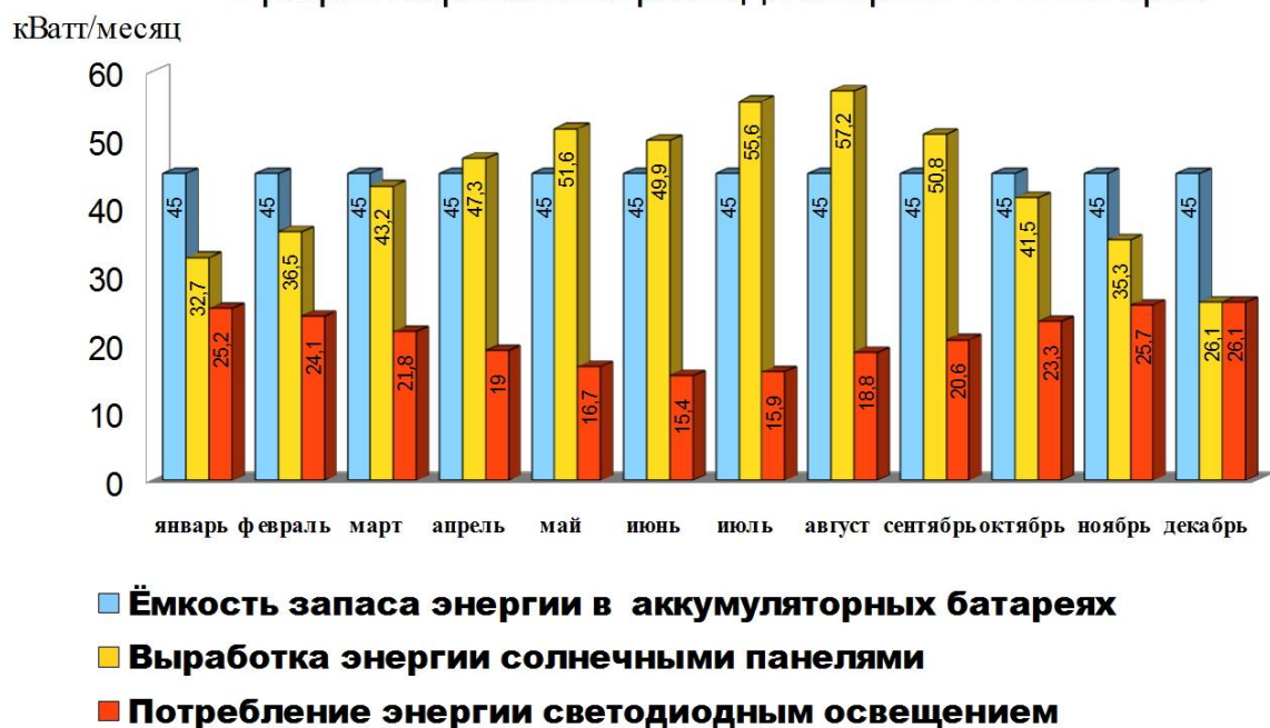
График выработки и расхода энергии г. Пятигорск